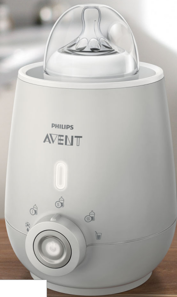
Philips AVENT Baby-Fläschchenwärmer