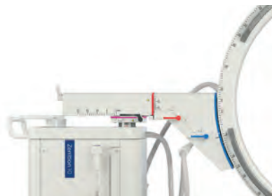
Codificação por cores

Com a interface de usuário intuitiva, o Zenition 10 permite que os usuários fiquem rapidamente confortáveis usando o sistema. Com a plataforma Zenition, você adquire uma variedade de sistemas harmonizados, concebidos para simplificar a utilização e agilizar o gerenciamento de equipamentos.