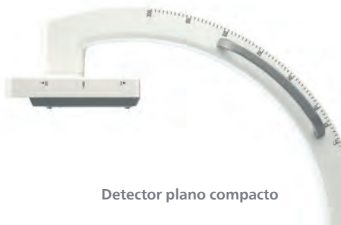
Detector plano compacto

Dia após dia, nossa tecnologia a-Si do Detector Plano (20 cm x 20 cm) fornece imagens sem distorção com excelente resolução e eficiência de dosagem na realização de uma ampla variedade de procedimentos cirúrgicos. Foi desenvolvido com base na extensa experiência da Philips em imagens de detectores planos para sistemas de arco cirúrgico fixos e móveis.