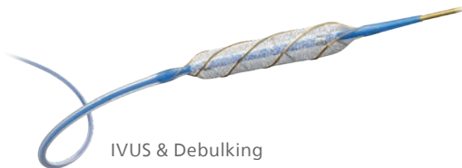
IVUS & Debulking