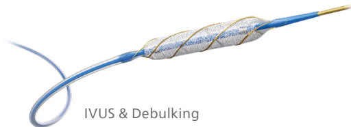
IVUS & Debulking