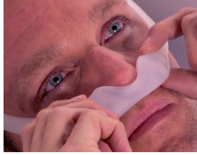
Réglage des fuites