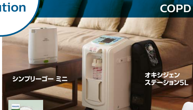
シンプリーゴー ミニ