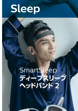
SmartSleep ディープスリープ ヘッドバンド 2