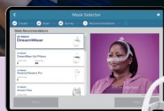
マスクセクター セミカスタムマスク