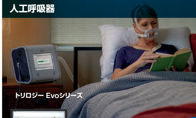
トリロジー Evoシリーズ