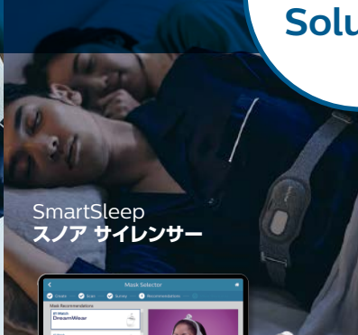
SmartSleep スノア サイレンサー