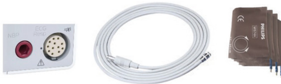
Verbindung zwischen Gerät und Schlauch