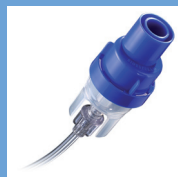
Nébuliseur SideStream usage unique par patient (remplacer après 1 mois)