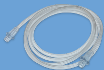
Tubulure du circuit d'air