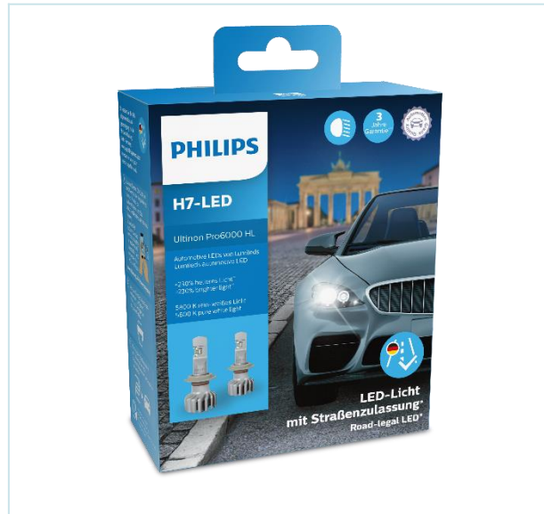
H7-LED X2 Verpackung, Inhalt 2 Lampen