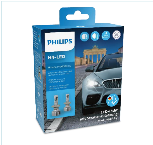
H4-LED X2 Verpackung, Inhalt 2 Lampen