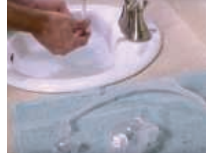
Entretien facile du masque

Retrouvez la réponse à vos questions pratiques sur www.apneesommeil.fr