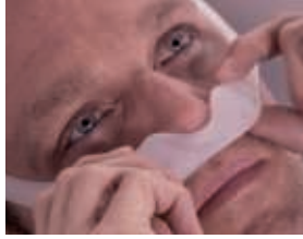
Réglage des fuites