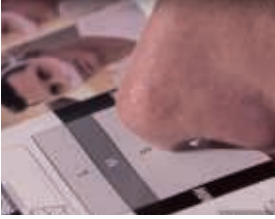
Choix de la taille et mise en place