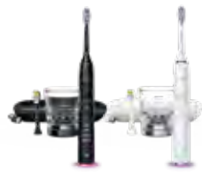
Philips Sonicare Diamond Clean Smart 9400