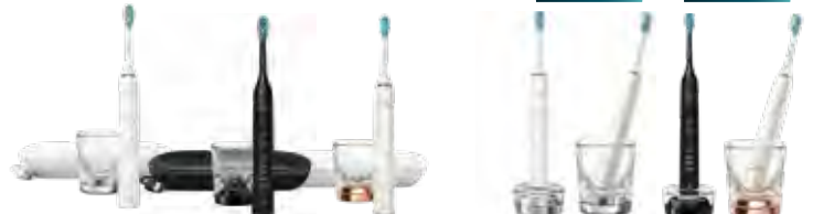
Philips Sonicare Diamond Clean 9000