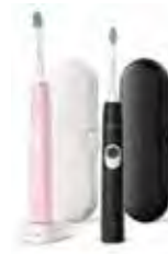
Philips Sonicare ProtectiveClean 4500