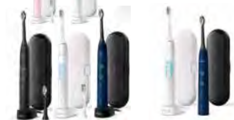
Philips Sonicare ProtectiveClean 6100