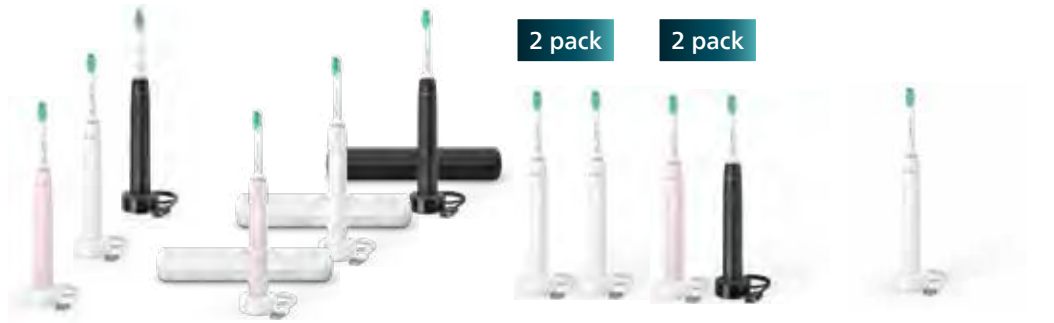
Philips Sonicare 3100