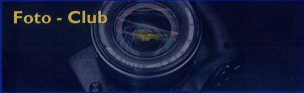
Foto - Club