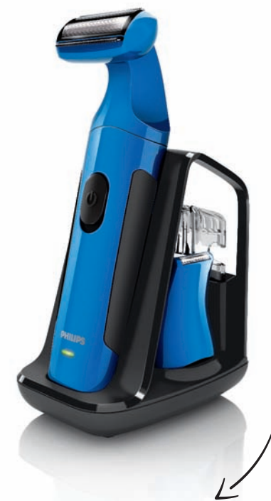
TONDEUSE MULTI-USAGES, ultra-compacte, ultra-complète, l'alliée indispensable pour être net de la tête aux pieds Référence : QG3280 Prix Public Indicatif : 69 € TTC