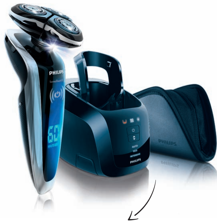
RASOIR SENSOTOUCH 3D, 100% étanche, un résultat impeccable dans le respect de la peau Référence : RQ1290 Prix Public Indicatif : 399 € TTC

Né aux Pays-Bas en 1891, Philips a bâti sa « success story » autour d'innovations majeures comme les lampes à filament de carbone, les téléviseurs, la radio, les rasoirs électriques, les cassettes audio, le DVD... Une vocation avant-gardiste, qui s'est transformée en une véritable philosophie de marque en matière de recherche et de développement ayant pour seul objectif, d'améliorer la qualité de vie des gens grâce à l'introduction d'innovations significatives.