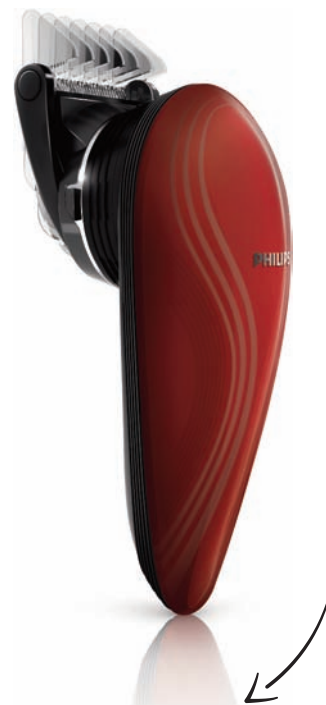
TONDEUSE CHEVEUX « DO IT YOURSELF », un 2-en-1 pour se tondre ou se raser le crâne soi-même Référence : QC5550 Prix Public Indicatif : 79 € TTC