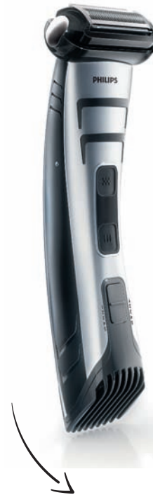
BODYGROOM, la solution pour raser ou tondre toutes les parties du corps masculin, facilement et sans aucun risque Référence : TT2040 Prix Public Indicatif : 69 € TTC