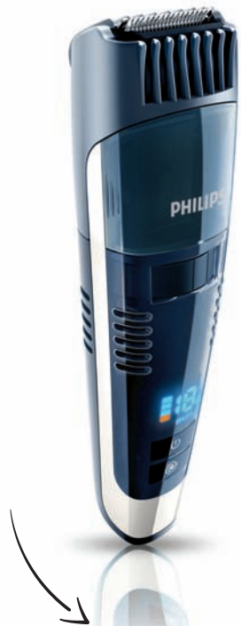
TONDEUSE BARBE A SYSTEME D'ASPIRATION DES POILS, une barbe impeccable, un lavabo qui reste propre Référence : QT4070 Prix Public Indicatif : 89 € TTC