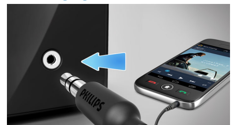
Audio-Eingang für einfaches Anschließen an nahezu jedes elektronische Gerät